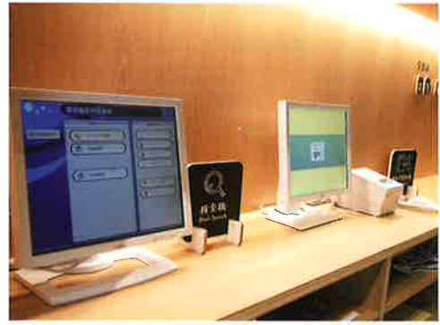
1階総合カウンター、こどもカウンター、2階のレファレンスカウンター付近の館内3か所にあります。