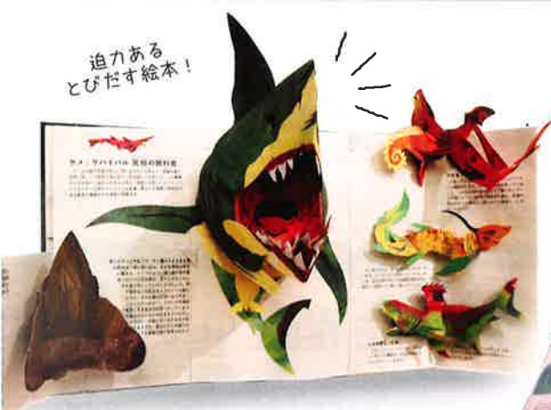
© 2006 by Robert Sabuda & Matthew Reinhart

2020年11月14日(土) ～ 12月20日(日) 10:00 - 18:00